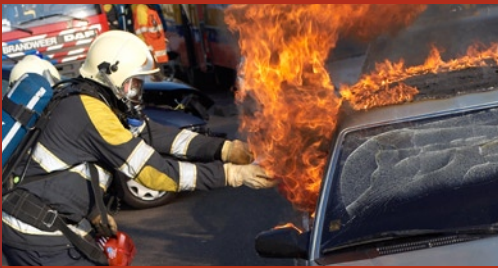
Actieve bestrijding bij brand

■ activeert zichzelf ■ eenvoudig in gebruik ■ geringe afmeting en gewicht ■ werkt direct bij contact met open vuur ■ voor binnen- en buitenbranden ■ vervolgschade blijft beperkt ■ geen onderhoudskosten ■ inhoud is mens-, dier- en milieuvriendelijk ■ 5 jaar garantie.