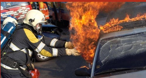
Contrasto attivo in caso di incendio

si attiva da solo ■ semplice da usare ■ dimensioni e peso ridotti ■ funziona immediatamente appena è a contatto col fuoco ■ per incendi all'interno e all'esterno ■ i danni conseguenti rimangono limitati ■ il contenuto rispetta le persone, gli animali e l'ambiente ■ 5 anni di garanzia