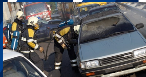
I danni derivati restano limitati