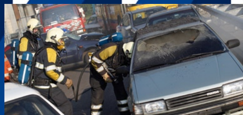
Limita los daños que puede causar el fuego